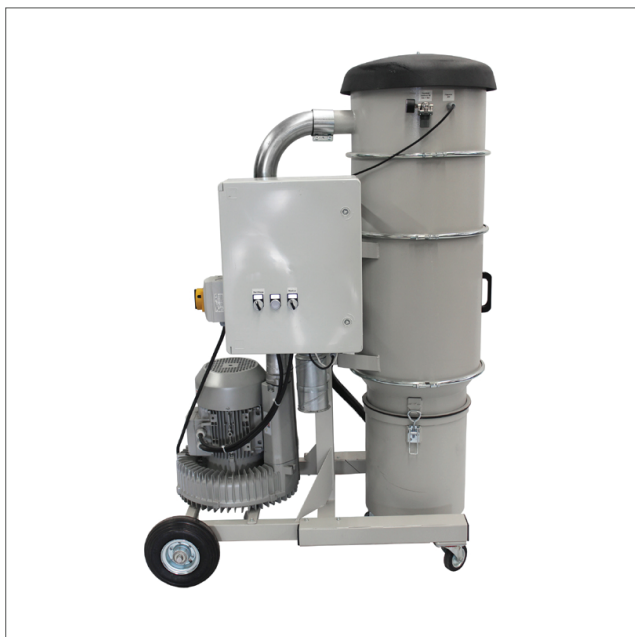
CE-MOB - Mobilt sugaggregat

Aggregatet används lämpligen för: Industriell dammsugning, svetspistoler/handverktyg, slipdamm från bygg/industriMiljø Stoftavskiljning sker i två steg: Grovavskiljning i cyklon och finavskiljning i veckat koniskt patronfilter