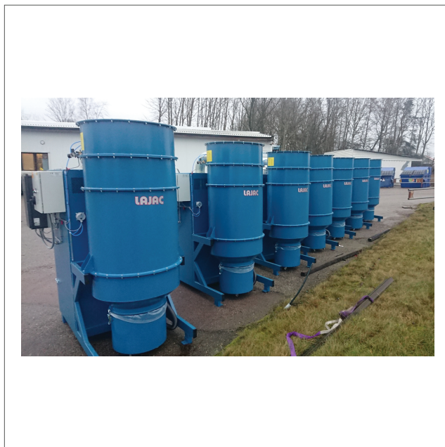
CE-25F-SE, filter 25kW med ljuddämpande huv