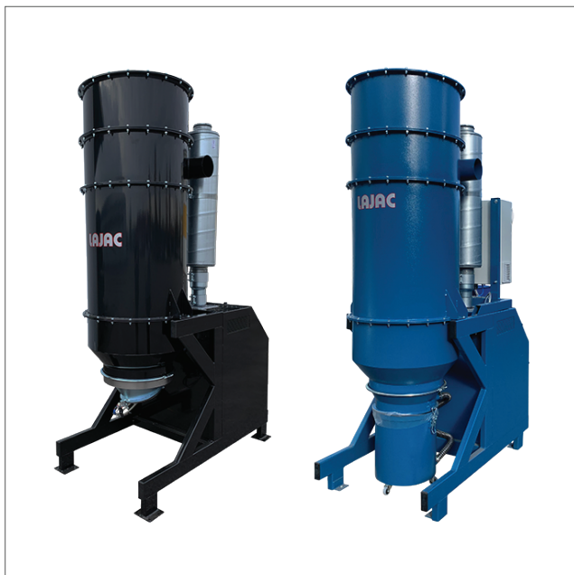
CE-F-SE - Centraldammsugare i olika färger

Stoftavskiljning sker i två steg: Grovavskiljning i cyklon och finavskiljning i veckat koniskt patronfilter