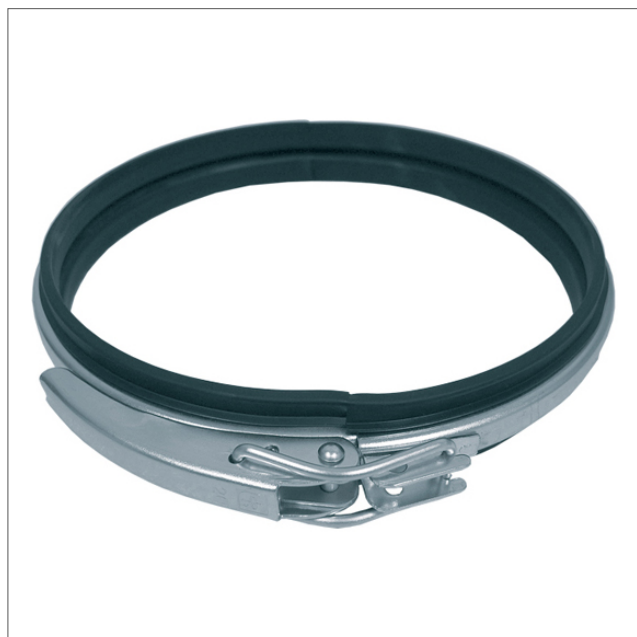
PRTE - Snabbspännband EPDM

Snabbspännband PRTE är elektrogalvaniserade och används för snabb och tät montering av kanalsystem. Utrustad med en gummipackning i EPDM som ger en tät anslutning och stabilitet i kanalsystemet, vilket säkerställer elektrisk ledningsförmåga genom aggregatet. Standardtemp. -30°C till +80°C. Med silikontätning för max 200°C - begär offert. Ø80 - Ø400 är försedda med snabbspänne/handtag, den kraftfulla stålfjädern ger högkvalitativ öppnings-/stängningsmekanism. Ø425 - Ø600 levereras med bult och mutter.