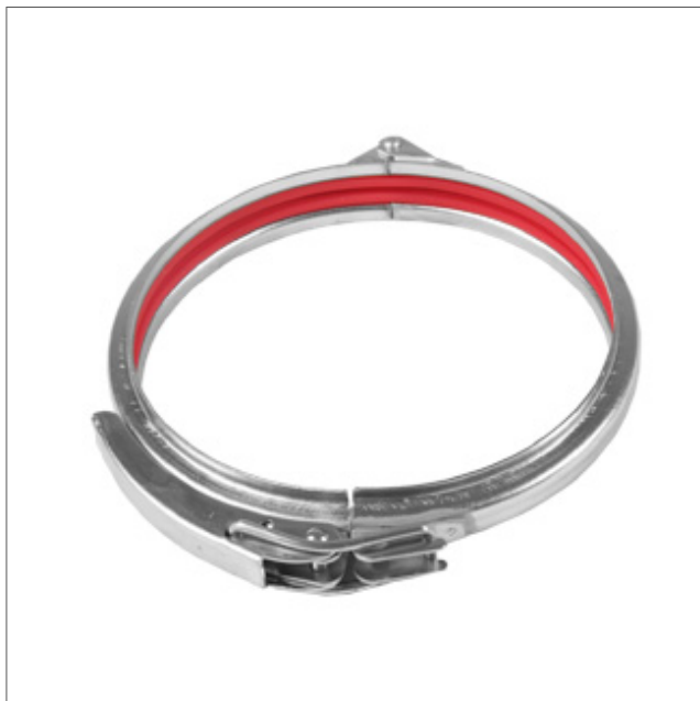
PRTE-1 - Snabbspännband PVC

Snabbspännband PRTE-1, galvaniserat med PVC-inlägg för 1 mm rörssystem. Standardtemperatur -30°C till +80°C. Med silikon för max. 200°C - begär offert.