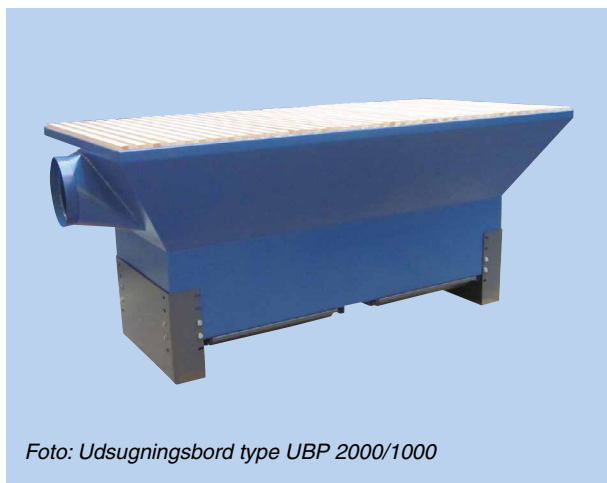
Foto: Udsugningsbord type UBP 2000/1000

Udsugningsbord med sug via bordflade. Kan anvendes som limbord, slibebord, pudsebord, svejsebord eller manuelt skærebord.